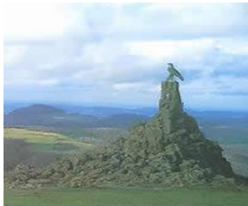
Fliegerdenkmal auf der Wasserkuppe

mit zwei Betten, Waschbecken mit warmem und kaltem Wasser und einem separaten WC. Bodenbelag: Teppich